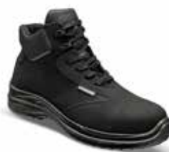
Roissy S3 SRC RINOS30NR